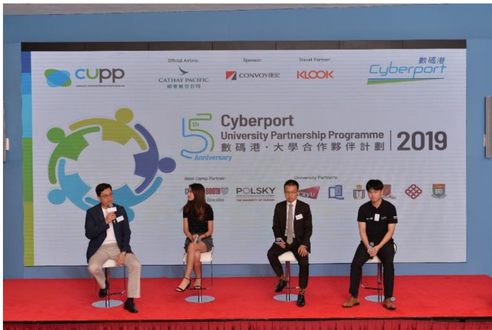
「數碼港·大學合作夥伴計劃」畢業生於啟動禮上，跟新一屆學員分享經驗。