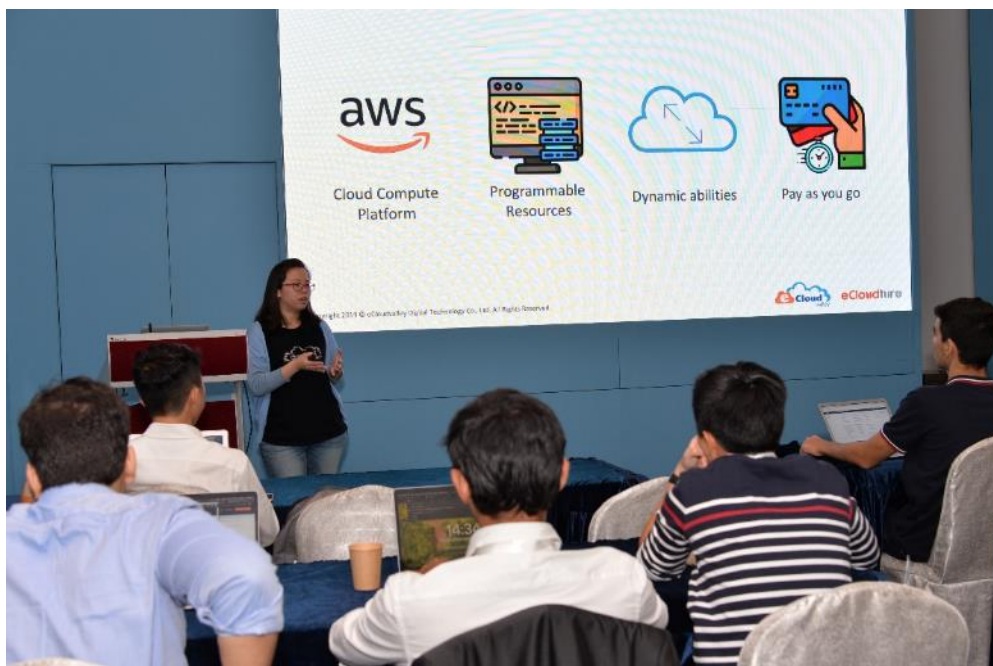
首場培訓於啟動禮後隨即進行，由 Amazon Web Services (AWS)及伊雲谷向參與學生講授雲端技術在金融科技的應用。